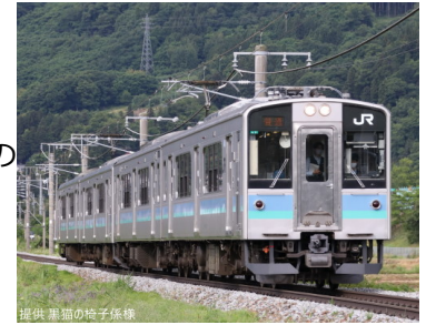
提供 栗館の松子様

URL https://desktopstation.net/sounds/osd121.html